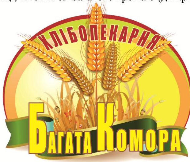
Рис.4 – Логотип ПП «Содомора-Хлібопекарня»

заслугує на довіру. У рекламі міститься ілюстрація пов'язана з фірмою, а саме колоски пшениці, як символ багатого врожаю (див.рис.4).